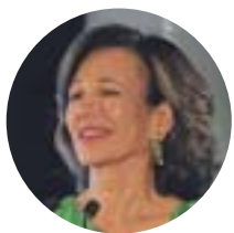
ANA BOTÍN Presidente do Grupo Santander

Durante estas quatro décadas, a escola tem vindo a crescer contribuindo para elevar a fasquia da do ensino superior em Portugal.