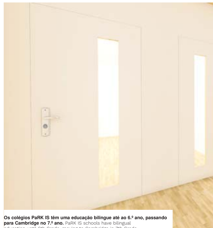
Os colégios PaRK IS têm uma educação bilingue até ao 6.º ano, passando para Cambridge no 7.º ano. PaRK IS schools have bilingual education until 6th Grade, moving to Cambridge in 7th Grade