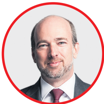
FILIFE LOWNDES MARQUES Advogados da Morais Leitão