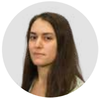
TEXTO INÊS PINTO MIGUEL

São muitos os gadgets, grandes ou pequenos, que têm apostado na Inteligência Artificial para dar o salto quântico, e depois a sua atratividade mede-se em reviews e também em vendas. Quais são os equipamentos que mais nos impressionaram e que merecem a atenção do mercado consumidor?