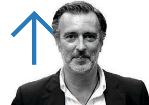
João Cotrim Figueiredo cabeça de lista da IL ■ Foi o único a ganhar votos relativamente às legislativas, chegando aos dois mandatos. Mostrou que vale mais do que o partido