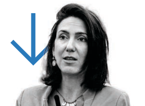
Valérie Hayer presidente do Renovar a Europa ■ Os liberais foram o grupo mais fustigado nas eleições, perdendo 23 lugares. Quase metade pelo desastre em França.