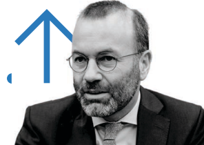
Manfred Weber presidente do PPE ■ O maior grupo do Parlamento Europeu recuperou terreno e cresceu, contra a maioria dos prognósticos.