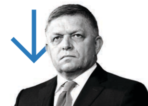
Robert Fico primeiro-ministro da Eslováquia ■ Reação do partido à tentativa de assassinato de Fico penalizou-o e passou de favorito a derrotado em poucos dias.