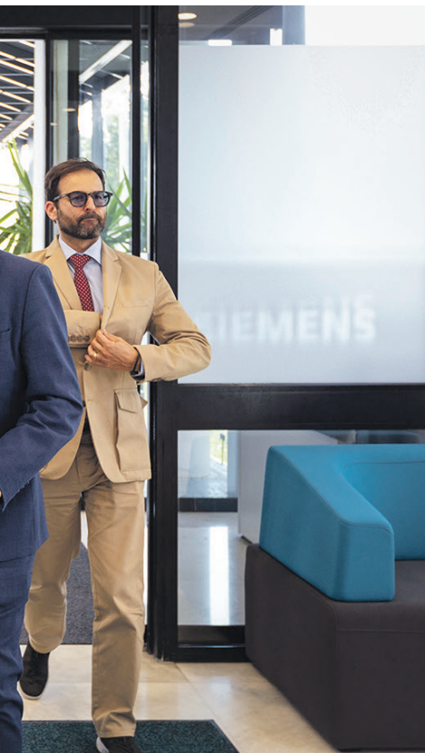
O secretário de Estado da Digitalização, Mário Campolargo, fez o encerramento do evento.

não está a ser desenhado na melhor orientação. “O Parlamento Europeu fez um disparate. Não tenho grande esperança. Veio exigir aos fornecedores destes sistemas que fizessem um resumo detalhado das obras protegidas por direitos de autor”, lamentou sobre aquilo que considera uma “regra impossível de cumprir”.